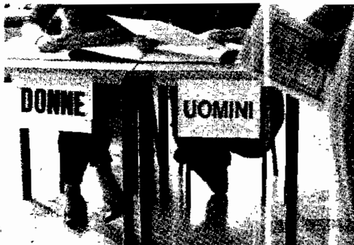
Oggi e domani 397 mila siciliani chiamati alle urne

Come si vota. La scheda per l'elezione del sindaco e del consiglio comunale è di colore azzurro, è rosa per il consiglio circoscrizionale, previsto per le frazioni di Aspra e Scoglitti. Sulla scheda elettorale ci sono i nomi e i cognomi dei candidati