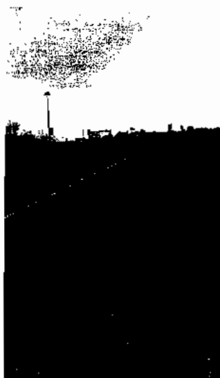
La circonvallazione di Pozzallo